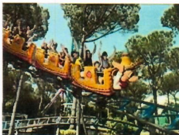
PARCO GIOCHI "CAVALLINI MATTO"