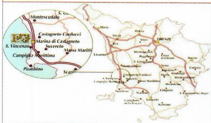
IL NOSTRO TERRITORIO

Il nostro vasto territorio offre tante possibilità..... Alcune sono queste