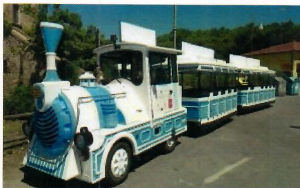
AL MARE CON IL TRENINO