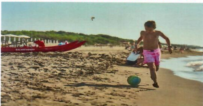
UN PO' DI RELAX