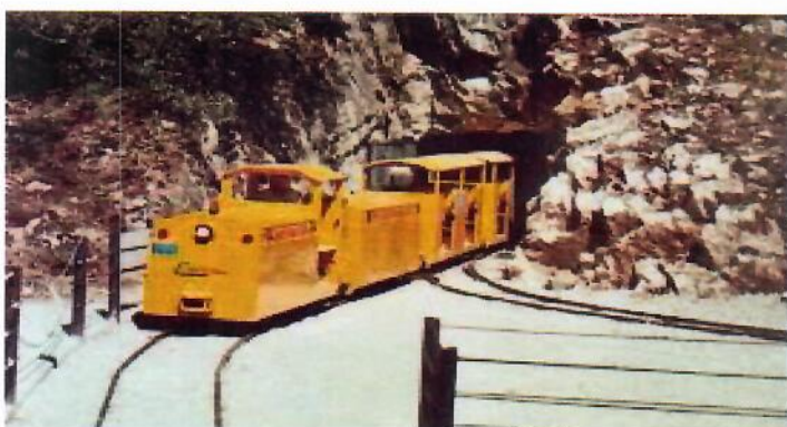
LA MINIERA MUSEO DI "CAMPIGLIA MARITTIMA"