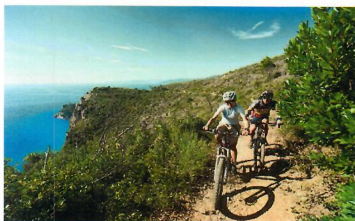
ESCURSIONI IN MOUNTAIN BIKE