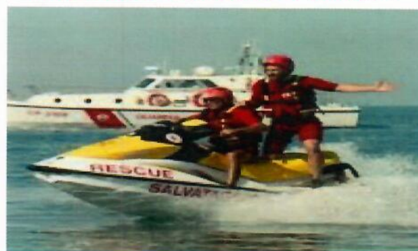
UNA DELLE NOSTRE ATTIVITÀ