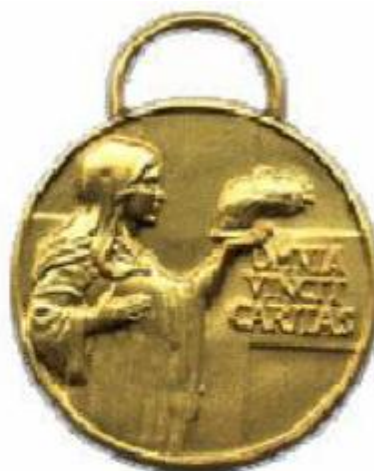
Medaglia di benemerenzza di 1° classe