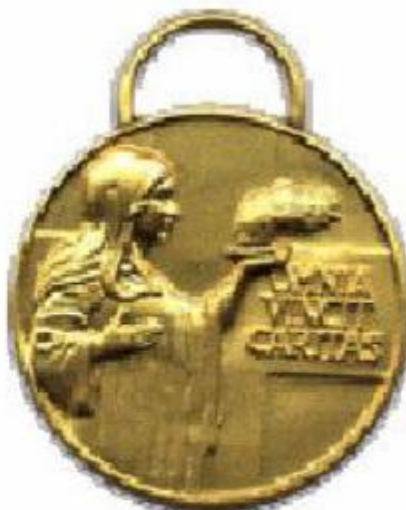
Medaglia di benemerenzza di 2° classe