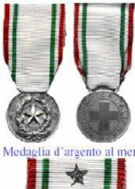
Medaglia d'argento al merito