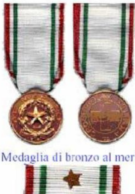
Medaglia di bronzo al merito