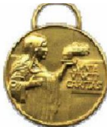
Medaglia di benemerenzza di 3° classe