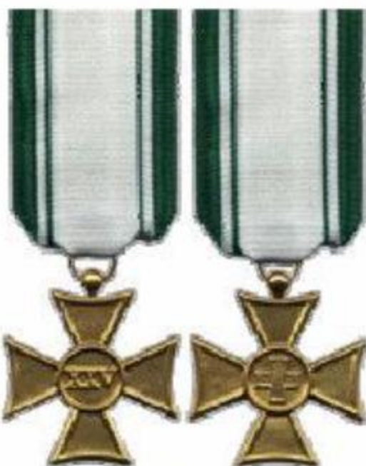
25 anni di anzianità (placcata in oro)